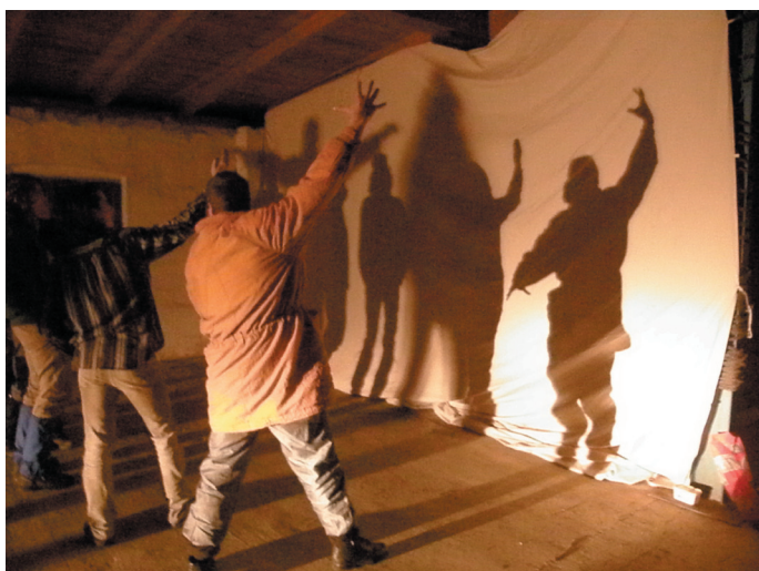
Divadlo stínů v MUNě 31. 12. 2010.

Sdružení přátel Jaroslava Foglara, o. s. (SPJF) , založené 28. prosince 1990, je nezisková organizace bez placených zaměstnanců, která navazuje na odkaz známého českého spisovatele, redaktora, skauta a pedagoga, který žil v letech 1907–1999. V současné době sdružuje přes 500 zájemců o Foglarovo dílo a přibližně 40 dětských mikrokolektivů - klubů bez dospělého vedoucího a dále i 15 oddílů a řadu dětských příznivců - stopařů, pro které vydává časopis a dále pořádá celoroční dlouhodobou dopisovatelskou hru.