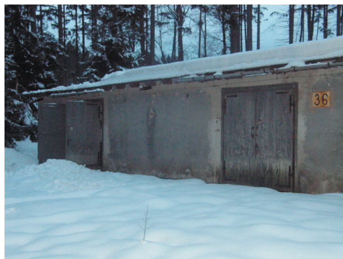
Objekt č. 36 pod sněhem.

Projekt rekonstrukce objektu č. 36 byl zahrnut do celostátního souhrnného projektu SPJF v programu Ministerstva školství mládeže a tělovýchovy (MŠMT) »Evropský rok dobrovolnictví«, který byl podán k posouzení MŠMT v průběhu měsíce ledna 2011. K datu