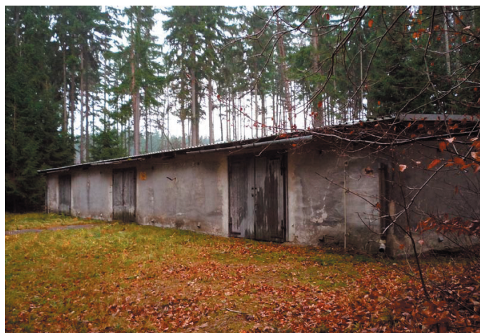
Objekt MUNy č. 36.

SPJF pořádá ročně asi 15 táborů a další víkendové akce pro děti a mládež, školení a semináře pro instruktory a vedoucí, společenské akce, besedy a výstavy pro širokou veřejnost. SPJF se zabývá i sběratelskou a badatelskou činností a odborným rozvíjením pedagogického potenciálu metod, které vytýčil Jaroslav Foglar. Poslední částí činnosti je program Hledáme lék na dětskou kriminalitu, v jehož rámci bylo vydáno několik videokazet a brožur.