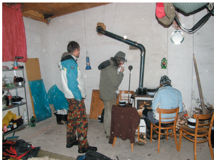
Mrázivý prozatímní přístřešek.